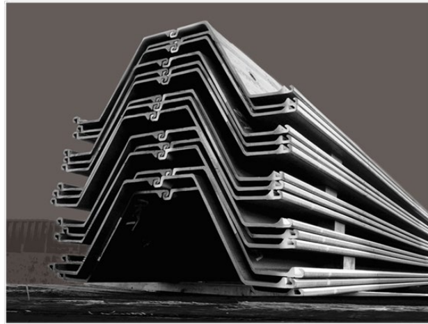
Palplanches en acier

Les palplanches en acier laminées à chaud sont des éléments en acier reliés entre eux par des serrures afin de former un mur continu quasi-imperméable.